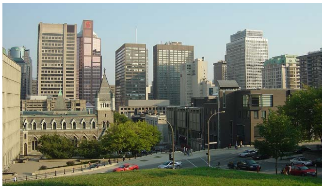
Skyline mit McGill-Universität im Vordergrund