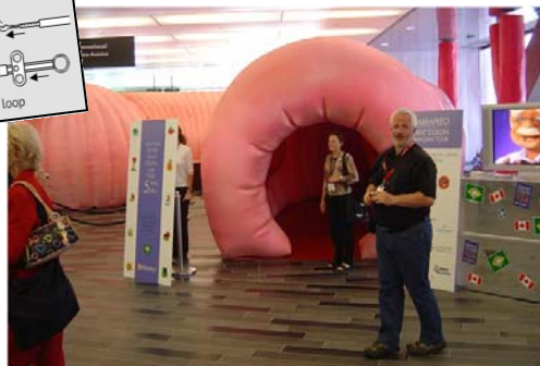
Begehrter Darm mit interaktiver Führung