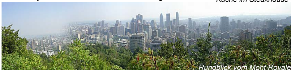
Rundblick vom Mont Royale