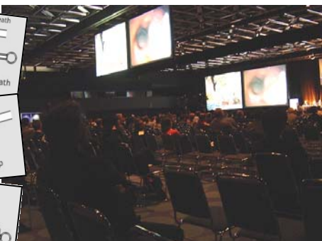
Vortragssaal mit Video-Leinwänden