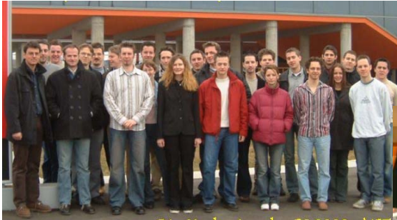
Studenten der Fachhochschule

Backgroundwissen — Strömungslehre und Druck — waren Studierende des Abendgymnasiums sowie die Maturanten der Waldorfschule zuständig.