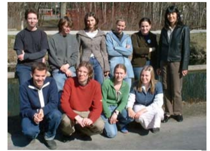
Maturajahrgang der Waldorfschule Klagenfurt

Web - Adresse : http://www.w-weitensfelder-chirurg.at/ScienceWeek03