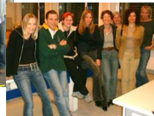
Studierende des Abendgymnasiums